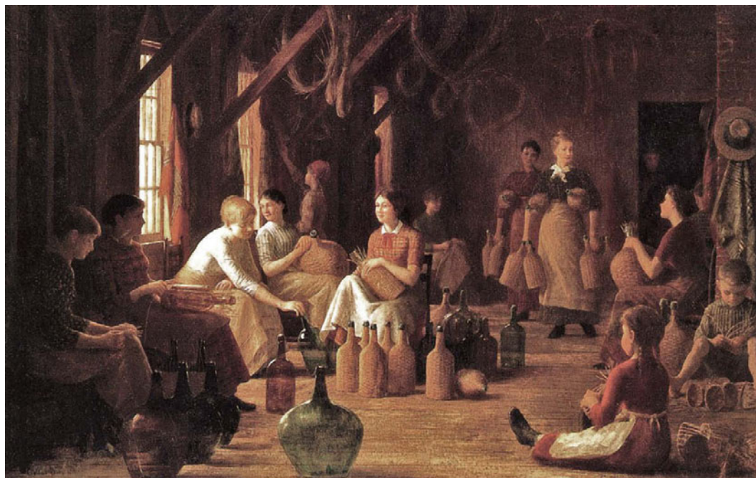
E. W. Perry, Donne al lavoro.

In Italia, presso le famiglie aristocratiche, era ancora diffusa l'usanza di affidare le ragazze, per l'educazione e l'istruzione, ai collegi religiosi. In altre parti d'Europa si diffondeva l'educazione laica. Ma anche in questi ambienti, si riteneva che le ragazze dovessero diventare mogli e madri e dovessero saper governare la casa, secondo le consuetudini.