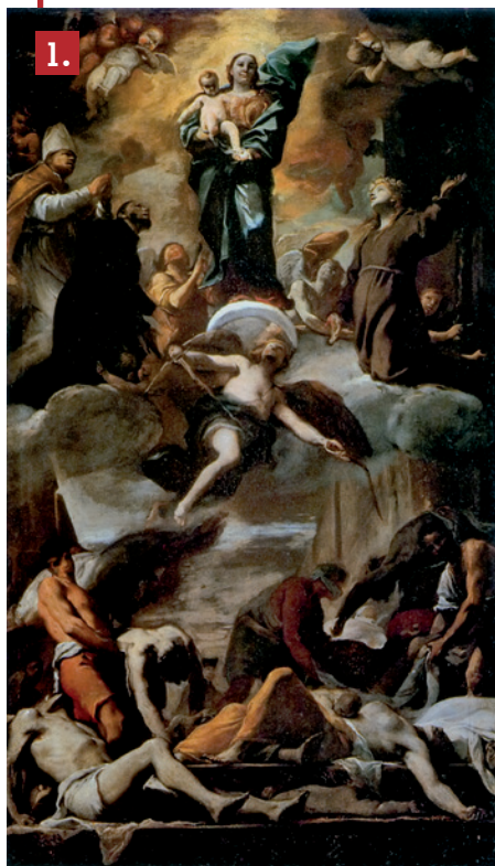
1. Mattia Preti, Bozzetto per gli affreschi sulla peste, 1656-1659. Napoli, Museo e Gallerie Nazionali di Capodimonte.