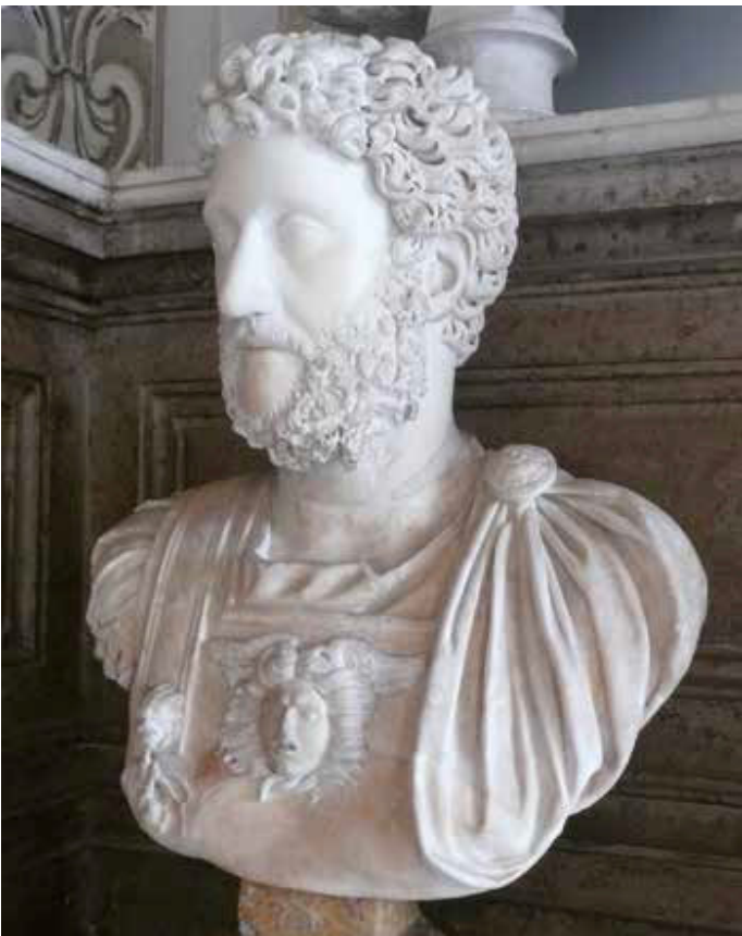
Ritratto ufficiale di Commodo. Roma, Musei Capitolini.

Il ritratto privato , più realistico, è caratterizzato dalla rappresentazione di tratti fisionomici molto fedeli, che lasciano trasparire il carattere o i sentimenti delle persone raffigurate.