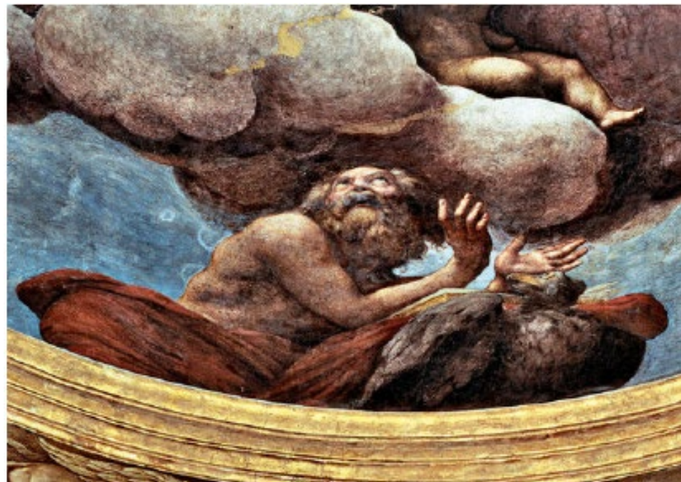
>> Correggio, Visione di San Giovanni Evangelista a Patmos , 1520-1524. Affresco, 9,4x8,75 m. Parma, Cupola della Chiesa di San Giovanni Evangelista. Particolare della figura di San Giovanni.

Oltre alle fortificazioni urbane, considerate dai contemporanei tra le più moderne d’Europa, egli fece realizzare i propri appartamenti privati sulla “via Coperta”, passaggio sopraelevato che univa il Palazzo Ducale al Castello , ornato da pavimentazioni marmoree e pareti con rilievi e affreschi a tema classico e mitologico. Il complesso fu demolito con il passaggio del Ducato di Ferrara alla Chiesa (1598), così come quasi nulla resta del Camerino d’alabastro , in cui operarono Antonio Lombardo, Giovanni Bellini e Tiziano. All’impresa prese parte anche Giovan Battista Luteri, conosciuto come Dosso Dossi .