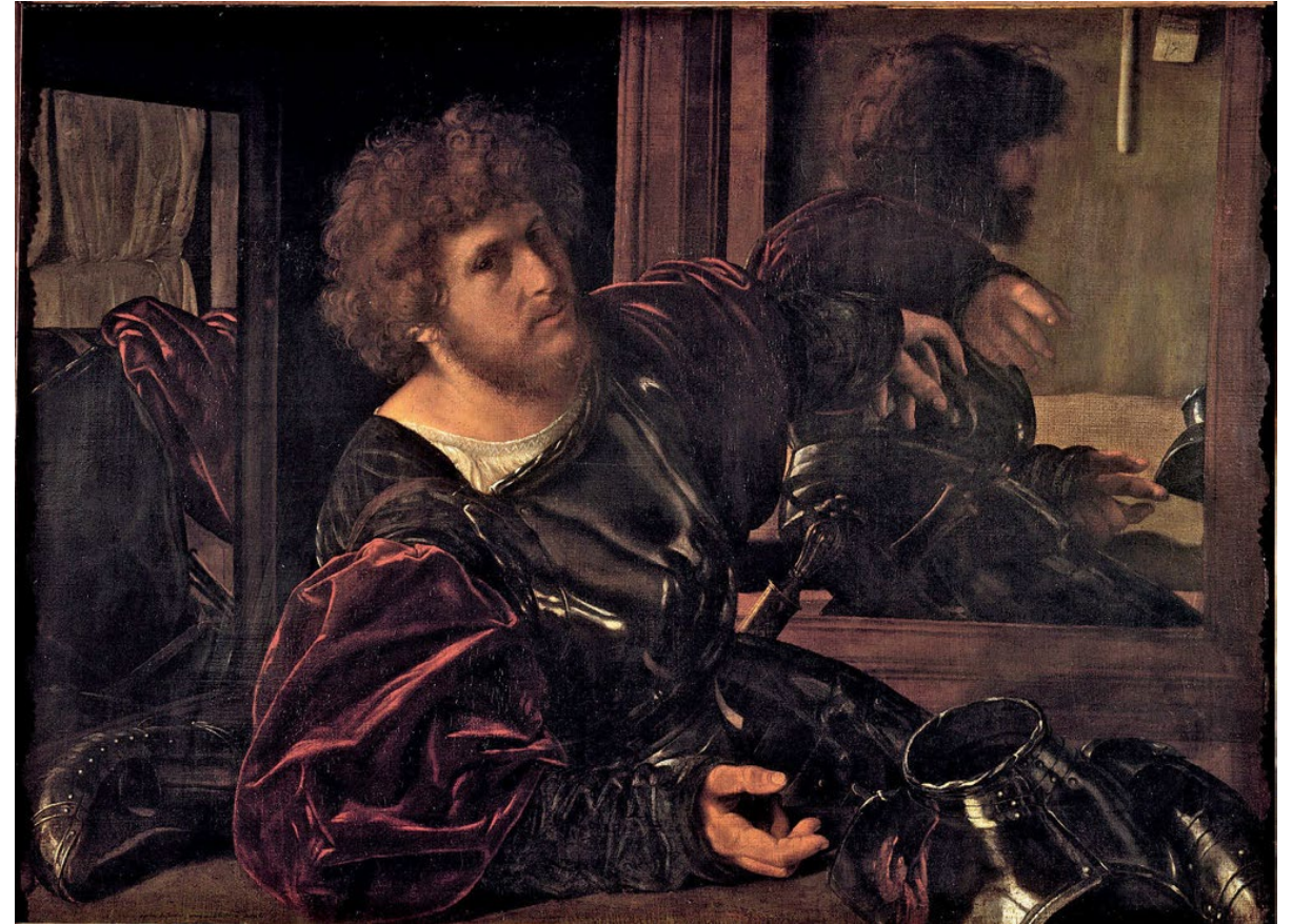
>> Giovan Girolamo Savoldo, Ritratto d'uomo in armatura , 1525 ca. Olio su tela, 91x123 cm. Parigi, Musée du Louvre.

RITRATTO D'UOMO IN ARMATURA Il dipinto è stato identificato sia come autoritratto , sia come il ritratto del condottiero francese Gaston de Foix-Nemours , in entrambi i casi senza conferme documentarie. Esso si propone come esercizio sul rapporto tra immagine reale e riflessa ; probabilmente l'opera corrisponde anche a uno studio sulle possibilità della pittura di competere con la scultura , ottenendo in una medesima immagine la percezione simultanea di più vedute dello stesso soggetto.