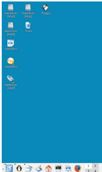
Desktop KDE (distribuzione Knoppix)

Esistono poi numerose interfacce grafiche per utilizzare Linux in modo facile, simili al desktop di Windows, con icone e finestre, per esempio i desktop KDE e GNOME .